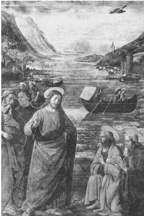
Domenico Ghirlandaio, „Die Berufung der Apostel Petrus und Andreas“, 1481, Fresko- Ausschnitt, Sixtinische Kapelle, Rom, Vatikan

kann sehen, dass Jesus jeden von ihnen kennt und auch weiß, was er an jedem einzelnen hat. So fügt der Film in seiner Interpretation dieser Geschichte den biblischen Worten noch etwas hinzu: Die Namen verbürgen nun nicht mehr nur die historische Existenz der Jünger, sie stehen nun auch für ganz individuelle Beziehungen zu dem, der sie beauftragt hat. Es blitzen Stärken auf und Schwächen, verschiedene Grade von