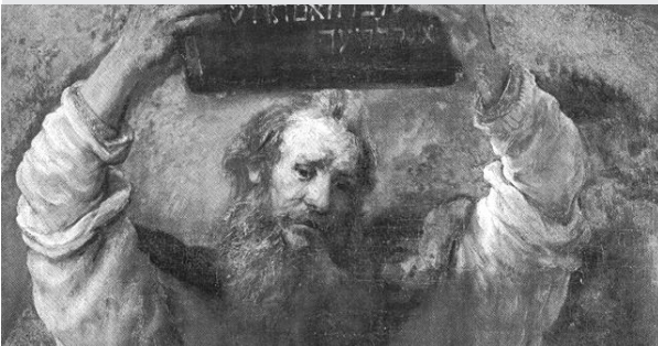
Moses überbrachte Weisungen zum Schuldenerlass. Ausschnitt aus dem Bild von Rembrandt „Moses zerbricht die Bundestafeln“