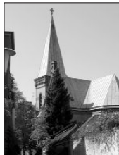
Die Umbauarbeiten sind weit fortge- schritten, hier ein Blick vom Hospiz