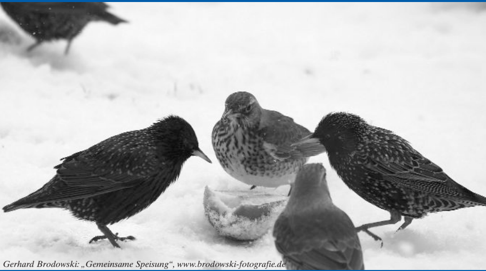
Gerhard Brodowski: „Gemeinsame Speisung“, www.brodowski-fotografie.de