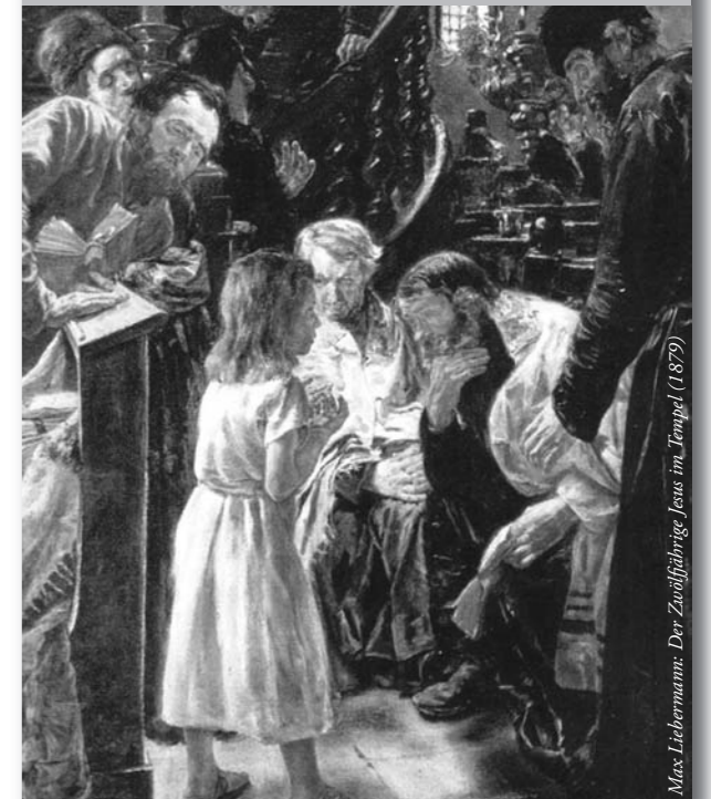
Max Liebermann: Der Zwölfjährige Jesus im Tempel (1879)