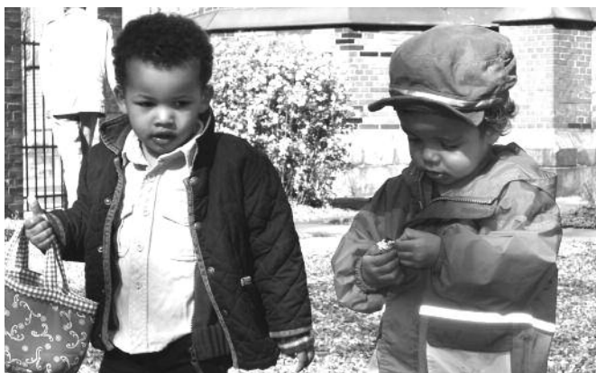
Zwei unserer kleinen Gartenhelfer untersuchen ihre Ernte: Ostereier