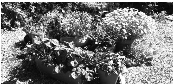
Im Kirchgarten der Johanniskirche