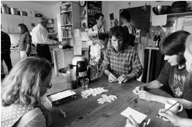
In der Wohnküche von „Brot & Rosen“ beim Spiel

Mehr als 180 Menschen aus 40 Ländern hat Brot & Rosen bisher beherbergt. Zuletzt war es eine afghanische Familie, Angehörige der Hazaras. Mit ihren zwei kleinen Kindern waren sie vier Jahre unterwegs gewesen: über Teheran, die Türkei, Griechenland, Mazedonien, Serbien, Ungarn bis nach Österreich; jede Grenze hatten sie zu Fuß überschritten. In Hamburg konnten sie nun in eine kirchliche Wohnung umziehen und hoffen, dort bleiben zu können, bis sie nicht mehr von Abschiebung bedroht sind.